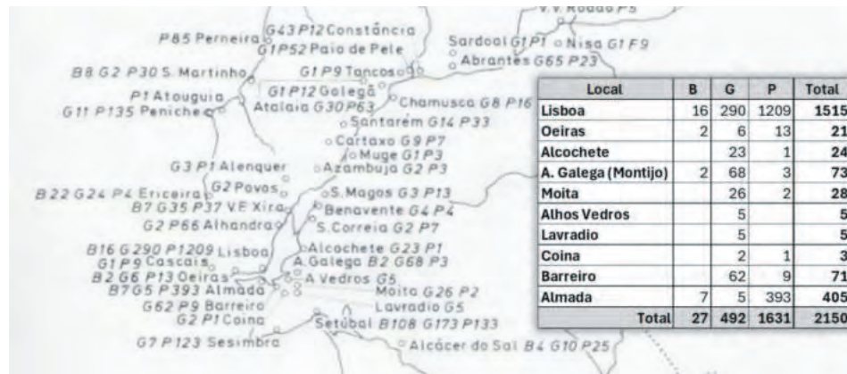
Figura_1: Distribuição de embarcações nas margens do estuário do Tejo em meados de 1820. Fonte - Intendência Geral da Polícia - Figura_2: Intervenção musculada de limpeza da JFPN, para restabelecer a operacionalidade da Rampa do Trancão, o único acesso público da cidade de Lisboa à via-da-água. - Figura_3: Preparação para a largada na Rampa do Trancão rumo à Póvoa de Santa Iria.

Com a entrada em funcionamento da Ponte 25 de abril em 1966, o transporte fluvial não regular foi abandonado, e a grande maioria destas embarcações tiveram de ser abatidas. No entanto, fruto do trabalho abnegado na preservação